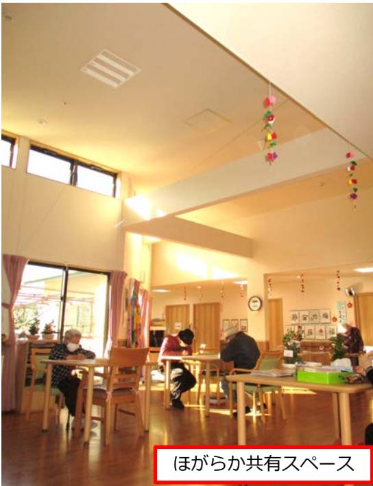
ほがらか共有スペース