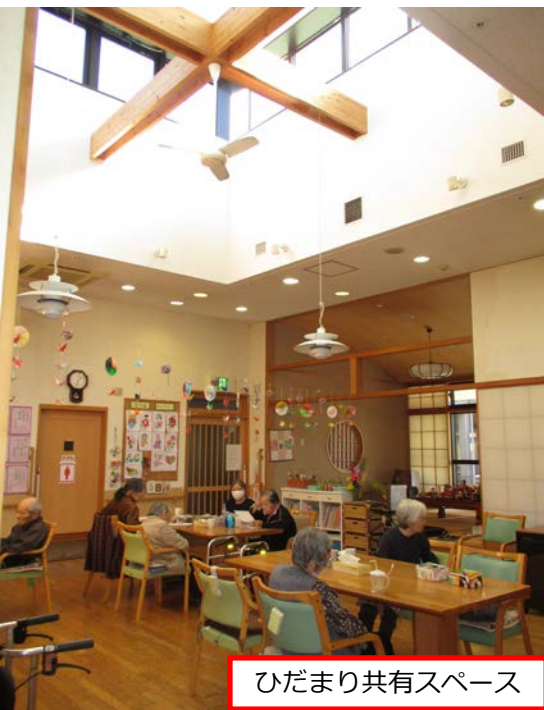
ひだまり共有スペース